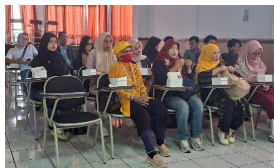
Gambar 5. Menulis Esai, sebagai Media Edukasi di Masyarakat ini, berhasil membangkitkan keberanian luar biasa dari para peserta.

Program ini menerapkan solusi holistik melalui tiga pilar utama. Pertama, pelatihan 5W+1H membimbing peserta menyusun esai secara sistematis. Contohnya, esai "Pengelolaan Banjir di Kota Semarang" menjawab what (fakta banjir), why (dampak ekonomi), where (wilayah pesisir), when (2025), who (warga dan pemerintah), serta how (strategi normalisasi sungai). Kedua, latihan conditioning harian melalui journaling 15 menit setiap pagi dilengkapi feedback positif, membangun kebiasaan menulis via penguatan emosional-logis. Ketiga, pendampingan reflektif oleh Tim fasilitator/pembimbing dari Program Studi Perencanaan Wilayah dan Kota fokus pada revisi tata bahasa, pengayaan kosakata, serta fungsi sosial menulis.