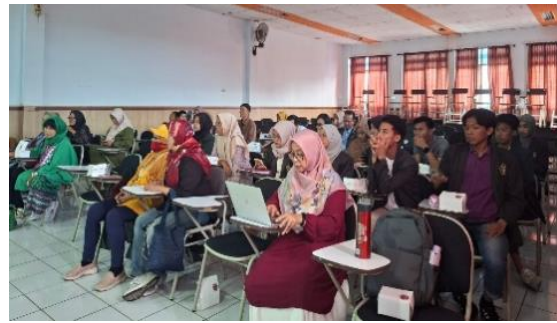
Gambar 3. Membangun rasa percaya diri dan kebiasaan menulis jangka panjang.

Pada tahap awal, stimulasi ide menjadi fondasi utama program. Pendekatan Quantum Learning diterapkan untuk membangun atmosfer belajar yang dinamis dan bebas hambatan psikologis. Peserta diajak menggunakan teknik mind mapping emosional, di mana mereka merangkai gagasan tentang isu lokal. Misalnya, membahas adaptasi banjir di permukiman padat, peserta dengan cepat menghasilkan 10-20 ide esai awal hanya dalam waktu dua jam. Suasana rileks dan menyenangkan membuat kreativitas mengalir bebas, sehingga gagasan yang muncul relevan dengan konteks sehari-hari seperti pencemaran lingkungan, pengelolaan sampah di kawasan urban atau pemanfaatan ruang terbuka hijau. Pendekatan ini berhasil mengurangi keengganan menulis, karena peserta merasa ide mereka dihargai dan dimiliki sepenuhnya.