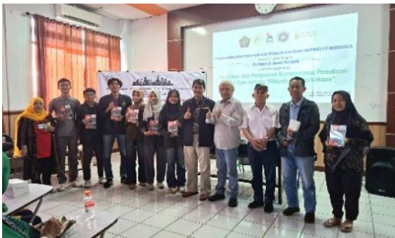
Gambar 4. Mereka percaya diri memaparkan karya esai di depan peserta lain, prestasi yang patut diapresiasi.

Program Penguatan Kompetensi Menulis Esai Melalui Penyusunan Buku Antologi Sebagai Media Edukasi di Masyarakat ini berhasil membangkitkan keberanian luar biasa dari para peserta. Mereka dengan percaya diri memaparkan karya esai di depan peserta lain, prestasi yang patut diapresiasi tinggi. Buku antologi hasil workshop ini berperan ganda sebagai alat edukasi dan transformasi sosial. Karya-karya tersebut menyajikan perspektif beragam dari penulis amatir yang mengangkat isu kompleks perencanaan wilayah dari sudut pandang lokal, sehingga memperkuat literasi masyarakat secara signifikan.