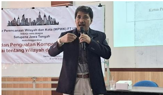
Gambar 2. Melaksanakan pendampingan menulis buku antologi esai.

Program pengabdian masyarakat ini berhasil melaksanakan pendampingan menulis buku antologi esai. Pendekatan ini terbukti efektif dalam meningkatkan kemampuan menulis melalui tiga tahap utama: stimulasi ide, drafting kolaboratif, dan publikasi antologi. Proses dimulai dengan menciptakan suasana belajar yang menyenangkan untuk merangsang kreativitas, dilanjutkan dengan kolaborasi kelompok untuk menyempurnakan draf, hingga menghasilkan buku yang siap dipublikasikan. Hasilnya, peserta tidak hanya menghasilkan karya tulis berkualitas, tetapi juga membangun rasa percaya diri dan kebiasaan menulis jangka panjang. Buku antologi yang lahir dari program ini membahas isu lokal seperti pengelolaan banjir, perencanaan kota berkelanjutan, dan pemberdayaan komunitas, sehingga berkontribusi pada transformasi sosial di tingkat masyarakat.