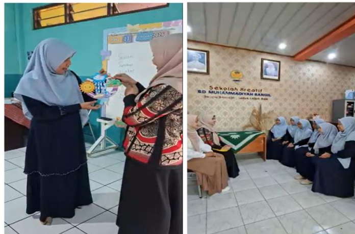
Gambar 4. Monitoring dan evaluasi kegiatan pendampingan

Kalimat yang disampaikan G5 dalam wawancara menunjukkan bahwa strategi yang digunakan tidak hanya berdampak pada guru, tetapi juga memicu dinamika kelas yang lebih interaktif.