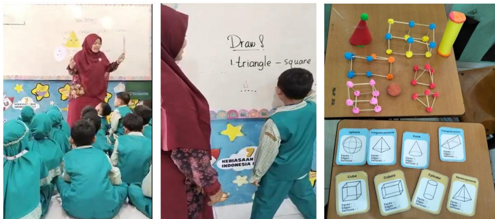
Gambar 3. Praktik guru dalam Pembelajaran Bahasa Inggris Berbasis Realia

Gambar 3 menunjukkan salah satu guru sedang menggunakan media realia buatan saat mengajarkan kosakata bahasa Inggris yang berkaitan dengan bentuk-bentuk ruang pada mata pelajaran matematika, seperti cube, sphere, cylinder, dan cone. Siswa tampak berinteraksi langsung dengan objek-objek tersebut melalui kegiatan memegang, mengamati, dan menyebutkan nama benda dalam bahasa Inggris. Situasi ini mencerminkan pergeseran pendekatan pembelajaran dari yang semula berbasis hafalan menuju pembelajaran berbasis pengalaman konkret dan kontekstual, sehingga membantu siswa membangun pemahaman kosakata secara lebih bermakna dan mudah diingat.