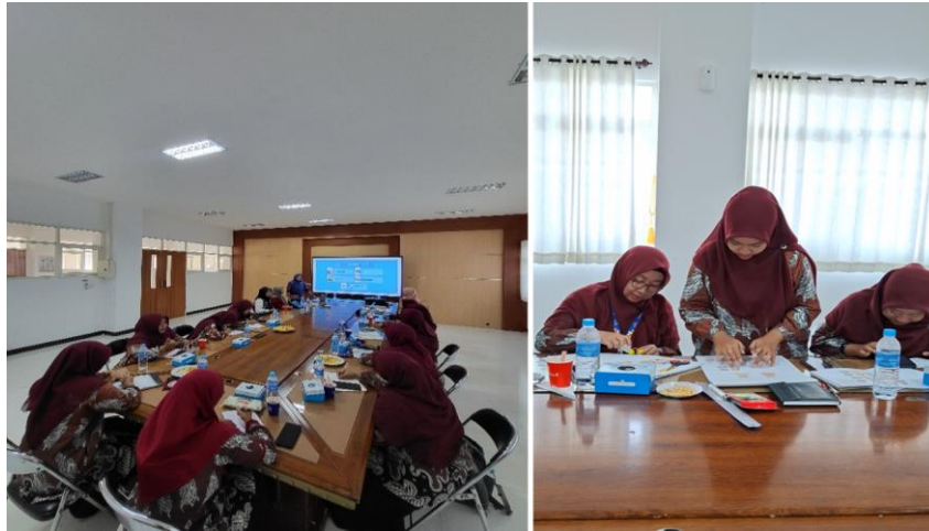
Gambar 2. Workshop Pembelajaran Berbasis Realia dan PjBL

Gambar 2 merupakan kegiatan workshop yang dilaksanakan secara interaktif di Kampus 3 Universitas Muhammadiyah Sidoarjo. Guru terlibat aktif dalam diskusi dan praktik perancangan pembelajaran menggunakan realia baik benda nyata maupun realia buatan yang tersedia di lingkungan sekitar. Proses ini menjadi tahap awal perubahan persepsi guru terhadap pembelajaran Bahasa Inggris. Setelah para guru mendapatkan pembekalan dari workshop, selanjutnya mereka mengimplementasikan ke kelas masing masing, seperti yang terlihat pada gambar 3.