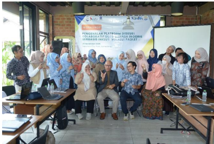
Gambar 4. Peserta pendampingan diskusi kolaboratif dengan berbantuan Padlet

Gambar 4 merupakan foto seluruh peserta, pemateri, pengelola kegiatan, dan panitia acara yang terlibat dalam kegiatan masyarakat ini.