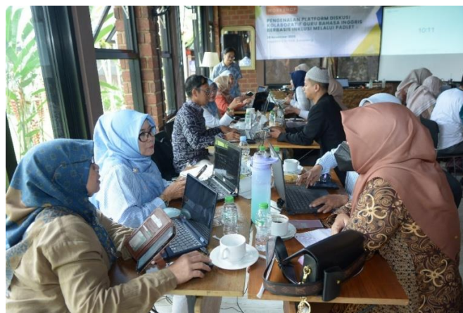
Gambar 2. Pendampingan diskusi kolaboratif dengan berbantuan Padlet

Gambar 2 menampilkan pendampingan praktik baik penggunaan Padlet sebagai media diskusi kolaboratif yang dilakukan. Pada tahap ini, peserta diminta untuk memunculkan sebuah isu pendidikan yang kemudian didiskusikan.