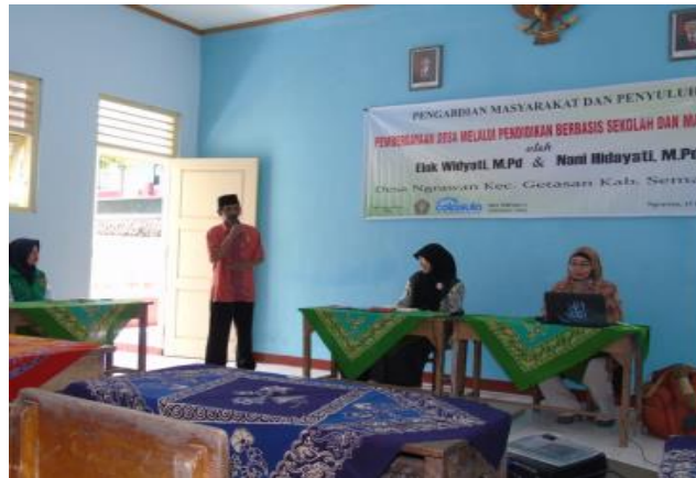
Gambar 1. Pemaparan materi

Gambar 1 menampilkan pemaparan materi yang merupakan landasan filosofis dari pentingnya pengembangan profesional guru bahasa Inggris dilakukan secara terus menerus dan berkelanjutan. Pemateri juga menyampaikan berbagai cara pengembangan profesional guru bahasa Inggris yang bisa dilakukan di tengah berbagai tantangan, misalnya keterbatasan akses.